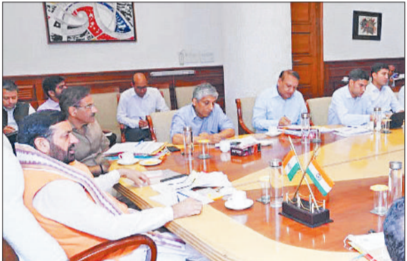
इकाइयों खर्च बचाने के लिए अपने अपशिष्ट जल उपचार संयंत्र नहीं चला रहे हैं और दूषित पानी छोड़ रहे हैं।