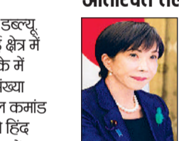
अप्रैल को जापान की पीएम नाए ताकाइची ने सऊदी अरब के क्राउन प्रिंस मोहम्मद बिन सलमान बिन अब्दुलअजीज अल-सऊद से फोन पर बात की और ईरान के हमलों से हुए जान-माल के नुकसान पर सऊदी अरब के साथ हमदर्दी जताई।

जापान सरकार ने घोषणा की है कि वह 1 मई से लगभग 20 दिनों तक अपने अतिरिक्त तेल भंडार को जारी करेगी। जापान के अर्थव्यवस्था, व्यापार और उद्योग मंत्रालय के अनुसार, दूसरी बार छोड़ने से 5.8 मिलियन किलोलीटर तेल निकलेगा, जिसकी कीमत 540 बिलियन येन (यूएसडी 3.4 बिलियन) है। 23 अप्रैल को जापान की पीएम नाए ताकाइची ने सऊदी अरब के क्राउन प्रिंस मोहम्मद बिन सलमान बिन अब्दुलअजीज अल-सऊद से फोन पर बात की और ईरान के हमलों से हुए जान-माल के नुकसान पर सऊदी अरब के साथ हमदर्दी जताई।