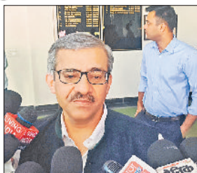
पत्रकारों से बात करते उच्च शिक्षा विभाग के सचिव डॉ. विनित जोशी।

भारत सरकार के शिक्षा मंत्रालय के उच्च शिक्षा विभाग के सचिव डॉ. विनित जोशी ने शुक्रवार को नेशनल इंस्टीट्यूट ऑफ टेक्नोलॉजी (एनआईटी) कुरुक्षेत्र का दौरा किया। इस दौरान उन्होंने बीते दिनों एनआईटी में हुई घटनाओं की समीक्षा की। मीडिया से बातचीत में डॉ. जोशी ने कहा कि मंत्रालय की तरफ से जांच के लिए आए हैं। यहां स्टूडेंट्स और टीचर्स से बातचीत की जा रही है। अभी हॉस्टल की जांच करेंगे। टीचर और स्टूडेंट्स के अपने-