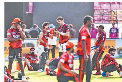
पुफुल्ल व वैभव फिर आमने-सामने, जरूरी अंक हासिल करने में मिड़ेंगे राजस्थान-हैदराबाद